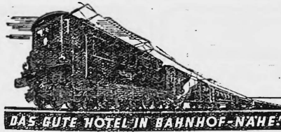
DAS GUTE HOTEL IN BAHNHOF-NAHE