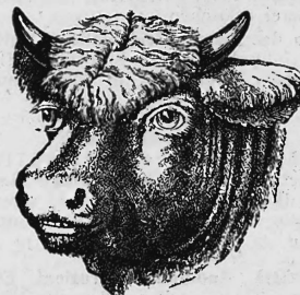
(Erneuerung der Nr. 9543.)

Senf; Speise-Stärkemehl, im Handelsverkehr unter der Benennung „Cornflour“ bekannt; Indigo und Ultramarin- blau; Stärke für Wäscherei- und Fabrikationszwecke.