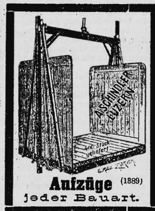
Aufzüge (1889) jeder Bauart.

In einem Kantonshauptort d. Nordwestschweiz ist ein an vorzügl. Geschäftslage, unmittelbar beim Bahnhof gelegenes, vor acht Jahren erbautes, geräumig, Magazingebäude, m. grossem Keller, Stallung etc. u. eigenem Geleiseanschluss u. verschiedenen maschin. Einrichtungen preiswürdig zu verkaufen. Event. könnte das Geschäft, das eine treue, 25jährige, ausgedehnte Kundschaft der Kolonialwaren- u. Landesproduktenbranche mit bedeutendem Umsatz besitzt, mit gesamt Inventar übernommen werden. Sehr günstige Gelegenheit. — Gefl. Offerten unter Chiffre B O 3037 an Rudolf Mosse, Basel. (161)