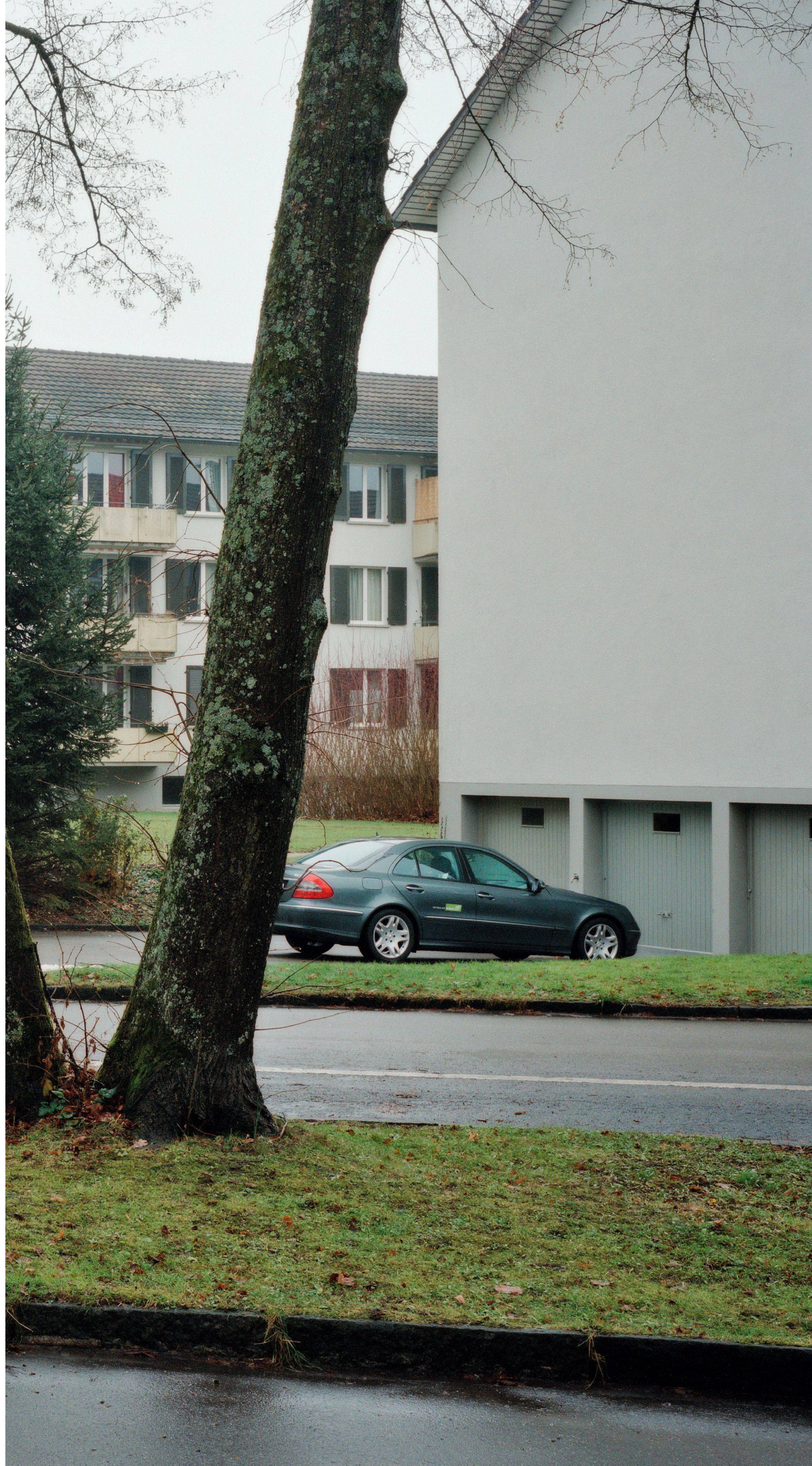
06 Anbau und Sanierung Hochhaus Weberstrasse, Winterthur

Rénovation et agran- dissement du tour d'habitation, Weber- strasse, Winterthur