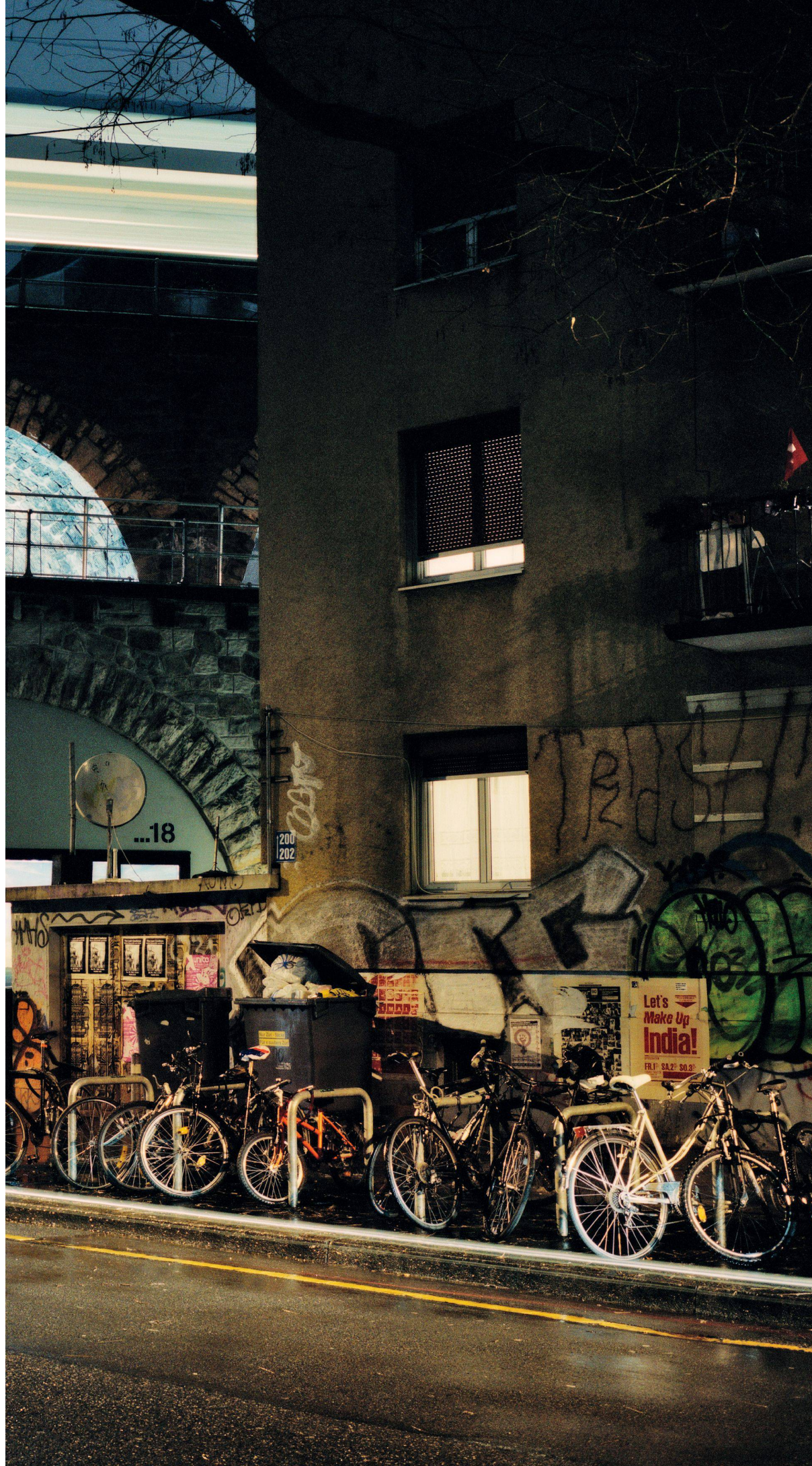
08 Umnutzung Eisenbahnviadukt im Industriequartier, Zürich