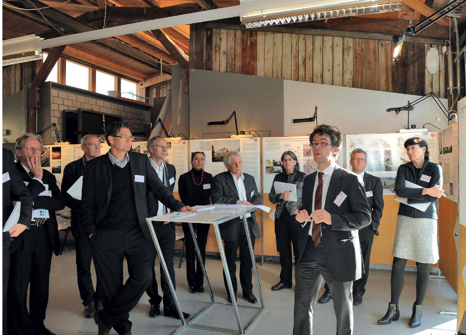
01 Präsentation und Diskussion der Projekte während der Jurierung / Présentation et discussion des différents projets lors de la réunion du jury / Presentazione e discussione dei progetti durante la valutazione della giuria