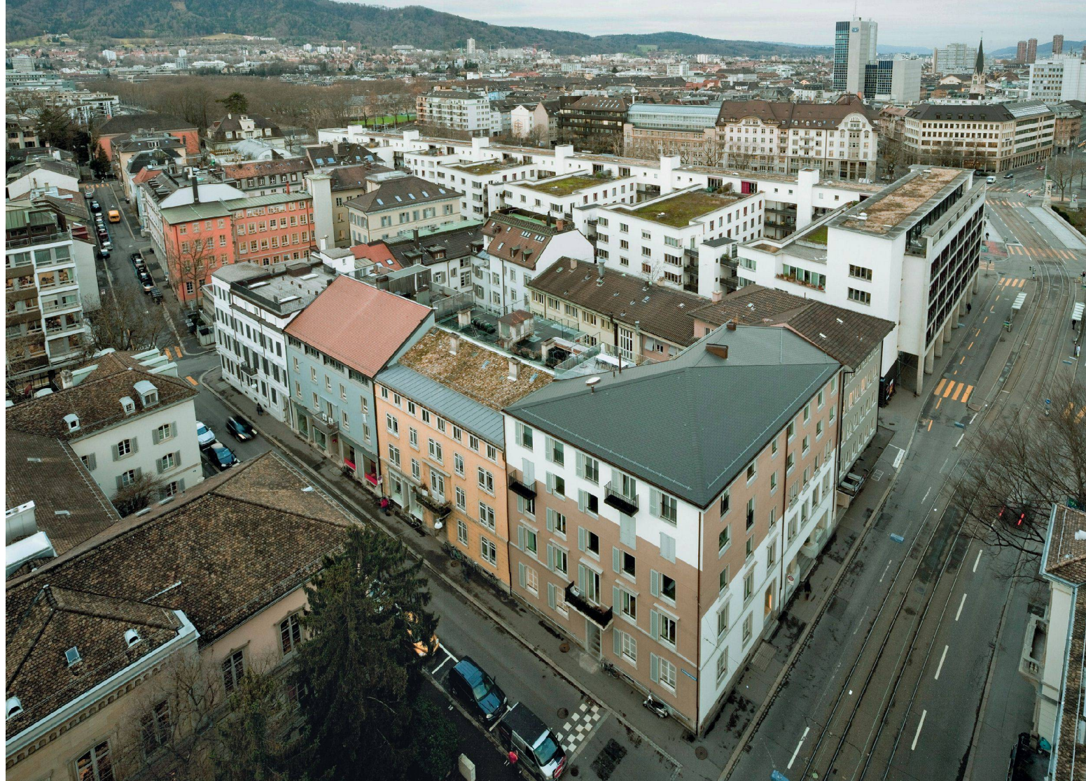
04 Wohn- und Geschäftshaus Selnaustrasse, Zürich (Eckhaus)/Immeuble résidentiel et commercial à la Selnaustrasse, Zurich (maison d'angle)/ Edificio abitativo e commerciale, Selnaustrasse, Zurigo (casa d'angolo)