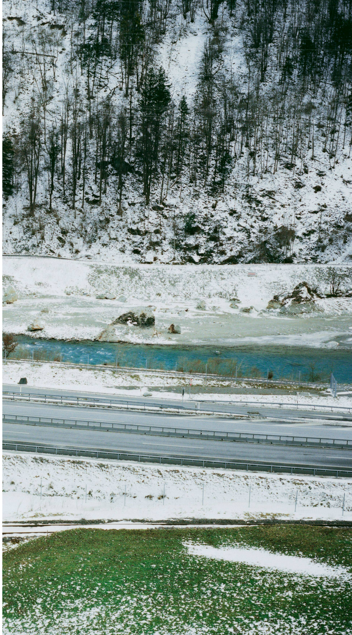
07 Gesamterneuerung der Nationalstrasse im Urner Talboden