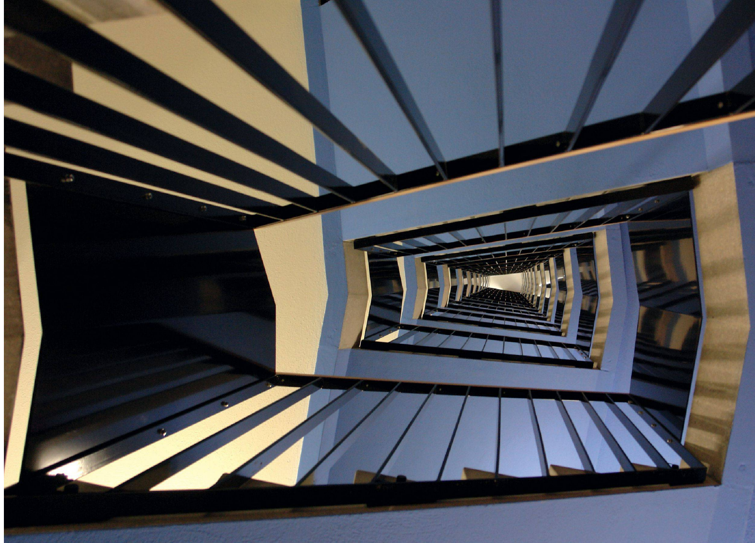
03 Hochhaus Weberstrasse, Winterthur (ZH)/Tour d'habitation, Weberstrasse, Winterthour (ZH)/ Edificio multipiano in Weberstrasse, Winterthur (ZH) (Foto/photo/foto: Burkhalter Sumi Architekten )