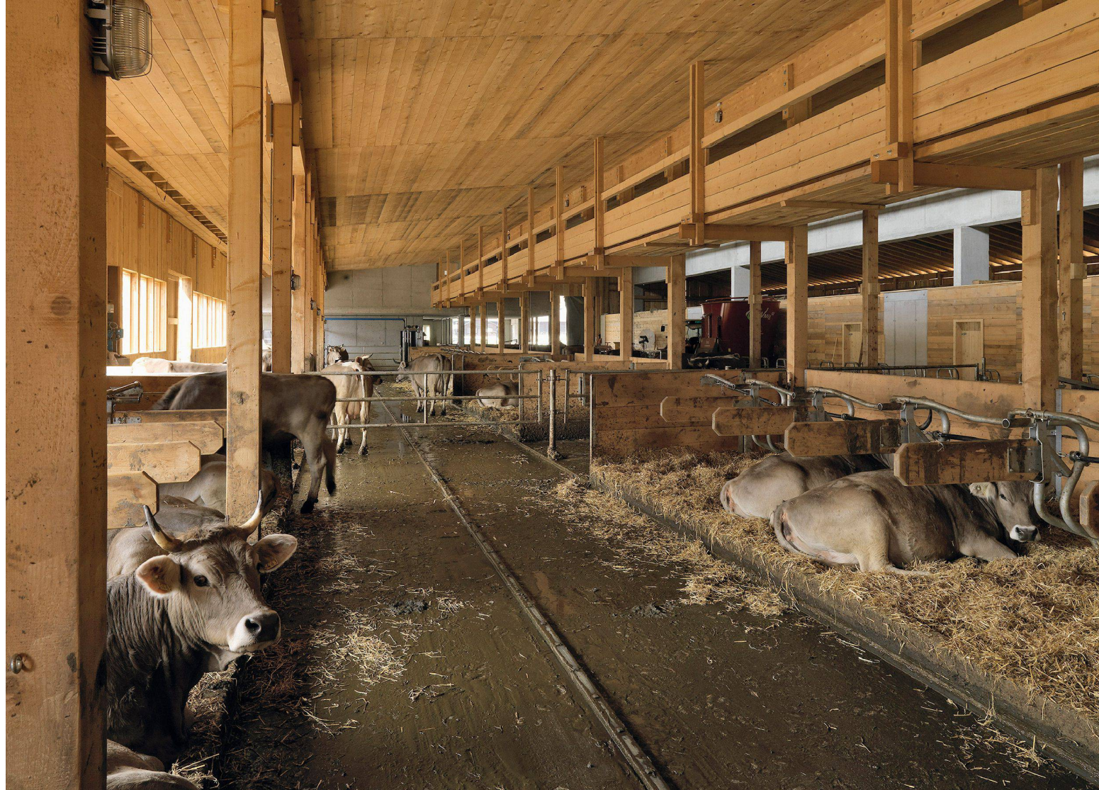
05 Landwirtschaftsbetrieb des Benediktinerklosters Disentis (GR)/ Ferme du monastère bénédictin, Disentis (GR)/Azienda agricola del convento benedettino di Disentis (GR)