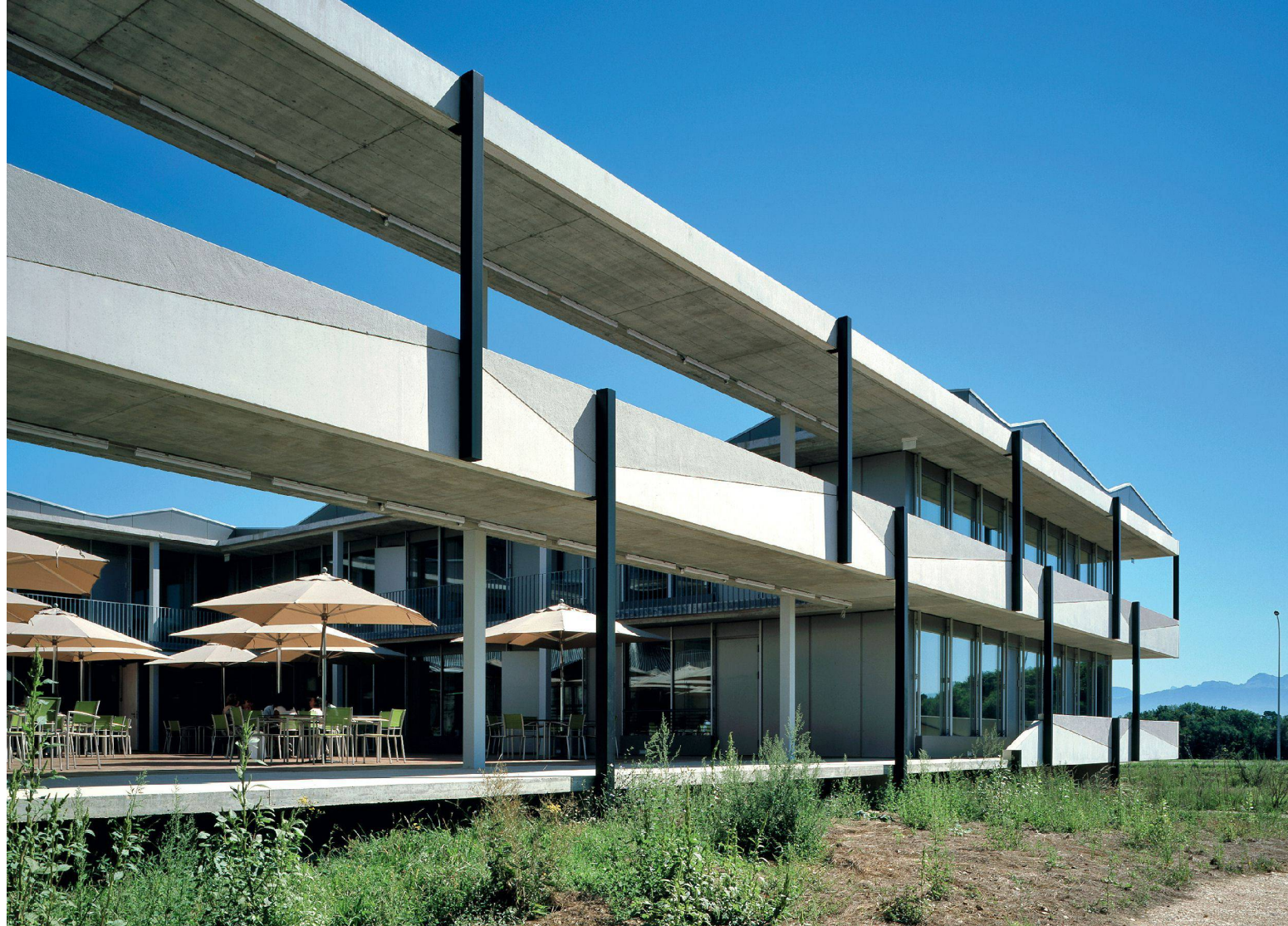
02 Erweiterungsbau IUCN, Gland (VD)/Extension du Centre UICN, Gland (VD)/Ampliamento del Centro UICN, Gland (VD)

48 Arbeiten, eingegeben von freiberuflichen SIA-Fachleuten, Behörden sowie institutionellen wie privaten Auftraggebern, zählten die Verfahrensbetreuer nach Ablauf der Eingabefrist Anfang August 2010. Das Spektrum der Arbeiten war, wie bereits vier Jahre zuvor, ausgesprochen breit: Es umfasste ebenso architektonische und ingenieurtechnische Eingriffe wie Planungs- und Entwicklungsinstrumente sowie Modelle der Bewirtschaftung von Bauwerken. Eingegeben wurden Arbeiten für eine einzelne Familie wie auch Planungsprozesse, die ganze Regionen betrafen. Noch deutlicher zeigten sich die Unterschiede der einzelnen Arbeiten im Vergleich der projektbezogenen Investitionssummen: Sie reichten von unter 100 000 Franken bis über 4 Milliarden Franken.