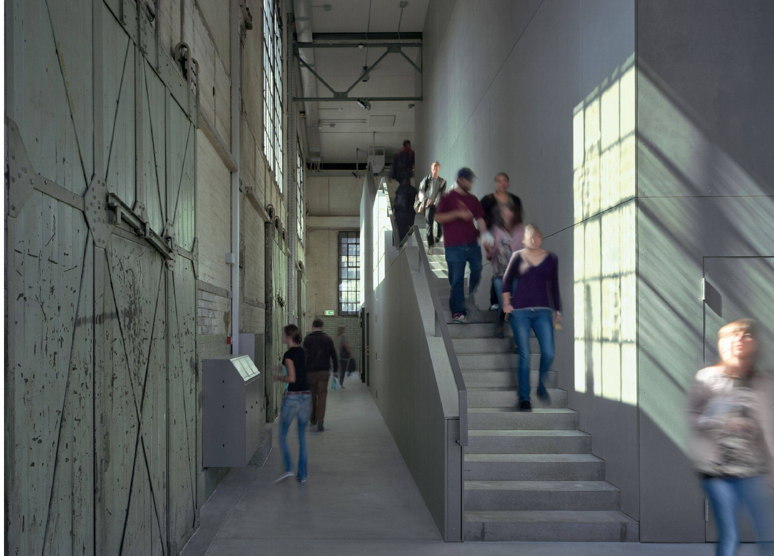
06 Hörsaalgebäude Weichenbauhalle, Uni Bern / Auditoires dans une halle de production désaffectée, Uni Berne / Padiglione di produzione trasformato in auditorio, Università di Berna

pi e, grazie alla loro portata, contribuissero in modo particolare all'organizzazione lungimirante dello spazio di vita svizzero. Scaduto il termine d'inoltro, fissato per inizio agosto 2010, il personale preposto ha contato 48 lavori, presentati da professionisti della SIA che esercitano un'attività indipendente, come pure da autorità e committenti istituzionali e privati. Così come quattro anni or sono, anche questa volta i progetti presentati sono stati diversi e ben assortiti. Tra i lavori si identificano interventi architettonici e tecnico-ingegneristici, strumenti di progettazione e sviluppo, nonché modelli di gestione edilizia. Sono stati presentati lavori concernenti una singola famiglia, così come processi di progettazione relativi a intere regioni. Le differenze che caratterizzano i singoli lavori risultano ancora più evidenti se si confrontano le somme d'investimento di ciascun progetto (da meno di 100 000 a oltre 4 miliardi di franchi).