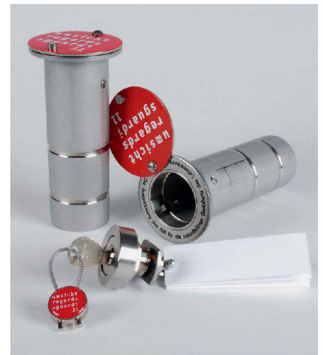
02 «Sesam»

Die acht Arbeiten der «Umsicht 2011» sind im Rahmen einer Wanderausstellung, nach deren Premiere in der Haupthalle der ETH Zürich, als nächstes vom 28. März bis zum 14. April an der ETH Höggerberg zu sehen. Anschliessend wird die Ausstellung an diversen Orten im In- und Ausland Station machen. Neben Bild- und Planmaterial zu den Projekten werden die Präsentationen durch ausdrucksstarke Bilder des Kunstfotografen Jules Spinatsch ergänzt. Kurzfilme des Filmschaffenden Marc Schwarz zu den ausgezeichneten Arbeiten mit Interviews mit den Projektverfassern und Jurymitgliedern ermöglichen ein gleichzeitig kurzweiliges und vertieftes Eintauchen in die Projekte.