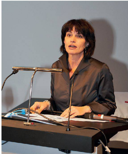
01 Bundesrätin Doris Leuthard