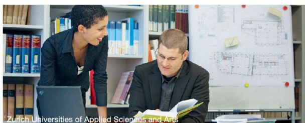
Zürich Universities of Applied Sciences and Arts

www.ifm.zhaw.ch/master | mscfm.lsfm@zhaw.ch