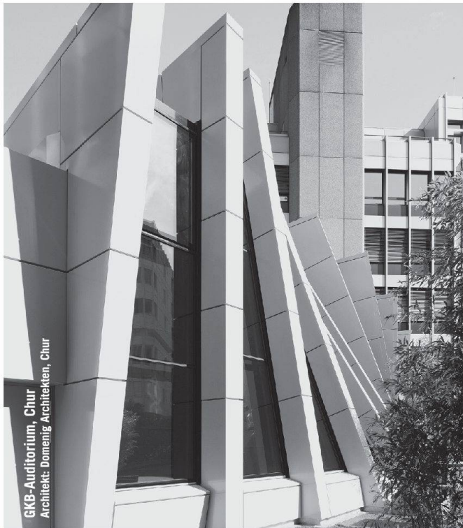
GKB-Auditorium, Chur Architekt: Domenig Architekten, Chur

Partner für anspruchsvolle Projekte in Stahl und Glas