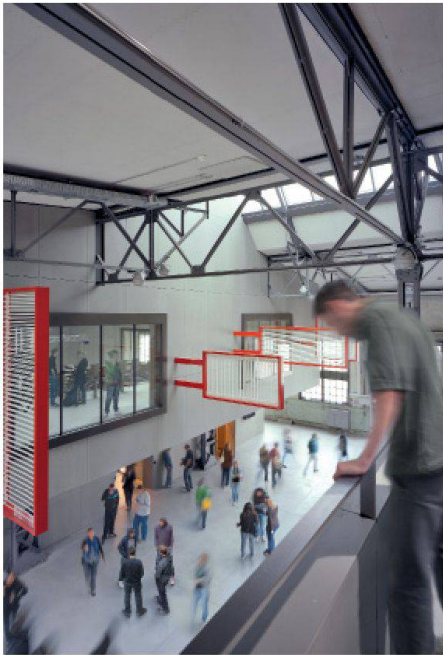
01 Hohe Anforderungen lassen sich kostenbewusst erfüllen: Hörsaalgebäude Weichenbauhalle, Areal von Roll Bern, Auszeichnung Umsicht-Regards-Sguardi 2011

Alle reden von Qualität und Kosten. Jeder meint aber etwas anderes. Als Mitglieder des «Runden Tische Baukultur Schweiz» laden der SIA, der SBV und die VSI.ASAI. deshalb zu ihrer ersten gemeinsamen Veranstaltung ein. Der Titel ist «Qualität contra Kosten? Wie Baukultur entsteht».