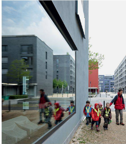
02 Tribeschen-Quartier (LU)

Das «Raumkonzept Schweiz» wurde sehr stark aus den bestehenden Qualitäten heraus entwickelt. In der Schweiz sind dies vor allem die vielfältigen, nahe beieinander liegenden Räume, von städtischen bis zu sehr naturnahen. Solche Qualitäten zu wahren, ist eines seiner Kernanliegen: Wir möchten nicht überall alles. Vor diesem Hintergrund wurde der neue Begriff des «Handlungsraums» eingeführt. Dessen Zielsetzung ist es, das Spezifische von Regionen, ihre Stärken, klar herauszukristallisieren, und zwar über die politisch-administrativen Grenzen hinaus. Statt primär Neues zu schaffen, will das Raumkonzept also vor allem zum Bestehenden gemeinsam Sorge tragen und dieses intelligent nutzen. Das mag nun wenig innovativ klingen, ist aber wohl eine der aktuell grössten Herausforderungen. Denn einerseits haben wir ein grosses Wachstum, das