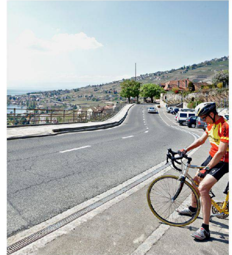
03 Eppesses (VD)

Bleiben wir noch kurz bei der Kritik. Das «Raumkonzept Schweiz» enthält manchen Satz, der meiner Meinung nach zwar schön tönt, aber als Widerspruch erscheint und damit nicht umsetzbar: «Die Förderung erneuerbarer Energien, ohne das Landschaftsbild zu stören», oder «die Stärkung der Verkehrsinfrastruktur, ohne Zersiedlung herbeizuführen».