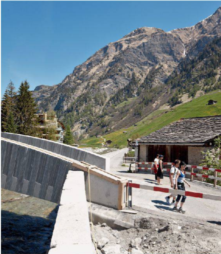
01 Vals (GR)