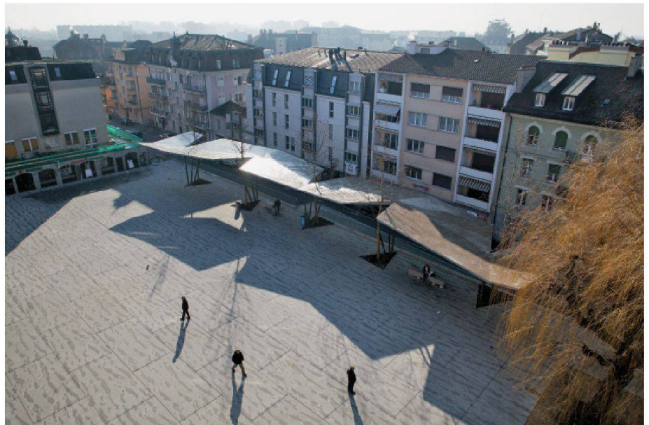
01 Marktplatz im «Cœur de Ville» von Renens: Das Gemeinschaftsprojekt von Stadt und Detailhändlern vereint öffentliche, kommerzielle und private Bedürfnisse