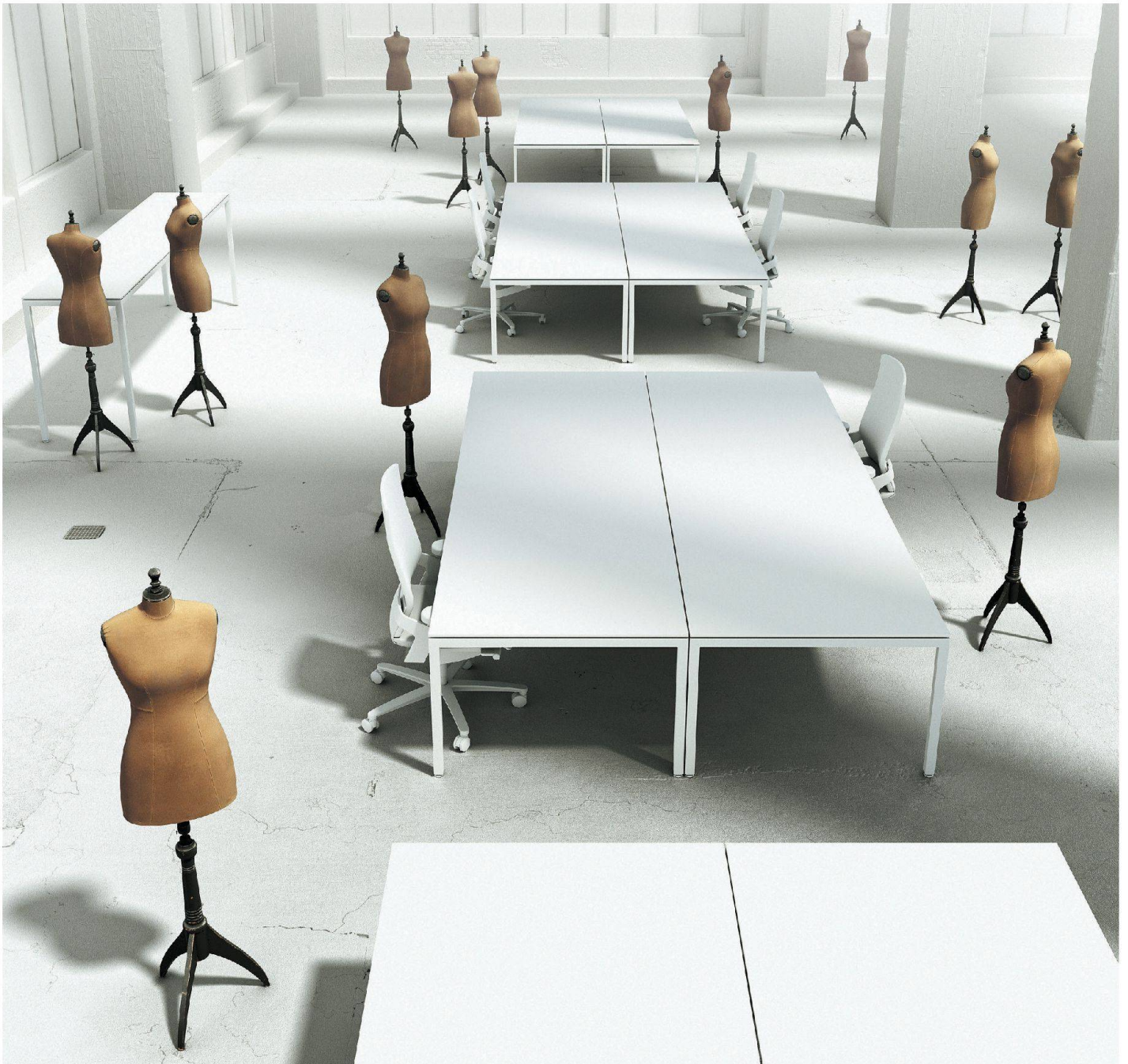
Tischsystem LO Motion

Lista Office LO in Ihrer Nähe > www.lista-office.com/vertrieb