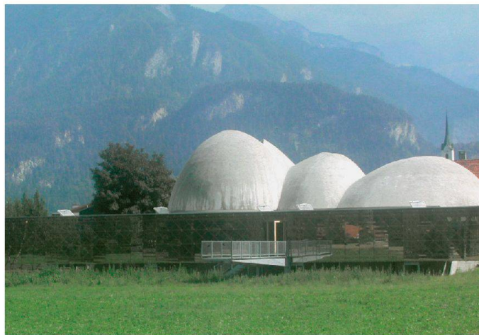
01-02 Steinkirche Cazis, Domleschg (GR): links geplant, rechts gebaut (Bilder: Werner Schmidt)

Im Grundsatz geht die sachenrechtliche Verfügungsfreiheit des Eigentümers eines Bauwerks dem urheberrechtlichen Werkintegritätsanspruch des Architekten vor. Dem Änderungsrecht der Bauherrschaft sind allerdings Schranken gesetzt – oder wie es das Gericht in einem spezifischen Fall bemerkte: «Der Bauherr darf viel – aber nicht alles.»