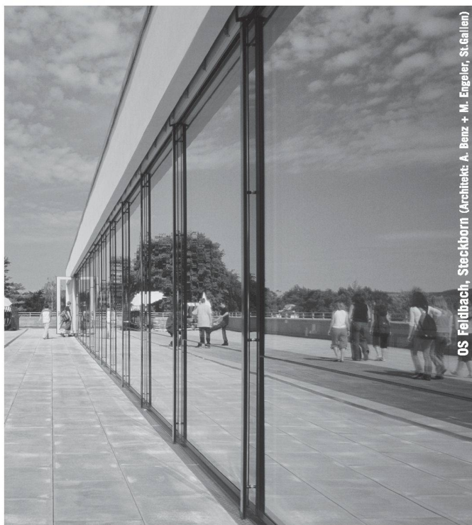
OS Feldbach, Steckborn (Architekt: A. Benz + M. Engeler, St.Gallen)

Partner für anspruchsvolle Projekte in Stahl und Glas