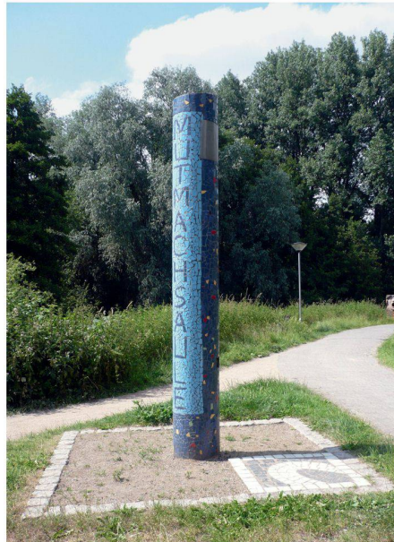
03 Die Mutmachsäule ist nur ein kleiner Mosaikstein des Darmstädter Projekts «Kinder als Bauherren»

43 europäische Städte mit mehr als 100 000 Einwohnern