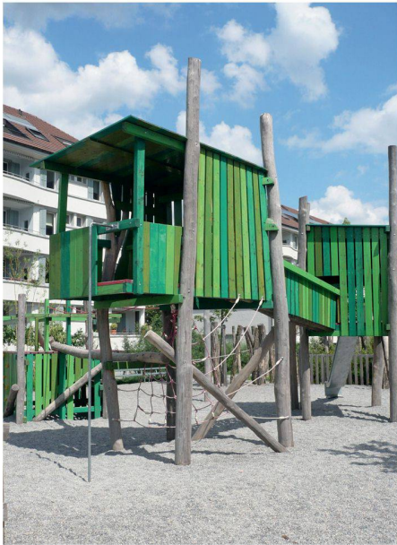
01 Quartierspielplatz Hardau, Zürich: Beim Streichen der Baumhäuser legten die Kinder selbst Hand an

Kinder und Jugendliche brauchen in unseren Städten mehr und adäquateren Platz. Projekte, die sich diese Aufgabe auf die Fahne geschrieben haben, will der neue Award «City for Children» auszeichnen und damit auch andere Städte zur Nachahmung anregen.