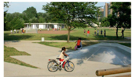
05 Das Jugendcafé «Chillmo» (hinten links) wurde zum zentralen Stadtteiltreff