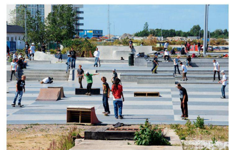
08 Alt und Jung, Anfänger und Profis treffen sich im Stapelbäddsparken