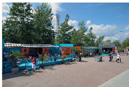
07 Café, Bibliothek und Klettertürme ergänzen die Skaterpools