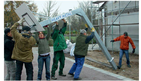
04 Eltern und Kinder trugen gemeinsam zum Gelingen bei