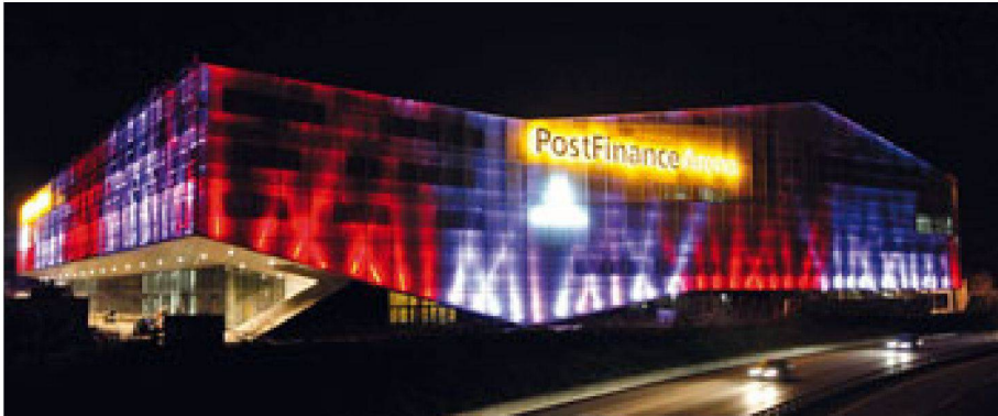
02 Die Fassade lässt sich nachts mit LED-Leuchten stimmungsvoll inszenieren

träger, Koppelpfetten und in der Dachfläche angeordnete Windverbände tragen die Dachlasten bzw. stabilisieren die Konstruktion. Weil die damals bereits bestehende offene Eisfläche nicht belastet werden durfte, wurden die Binder mit Pneukranen und die Querträger mit einem Helikopter versetzt.