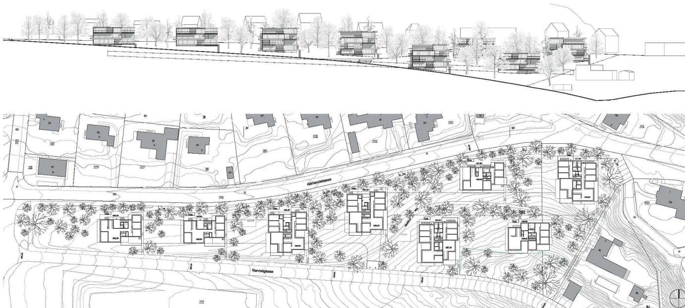
01 Siegerprojekt «Baumhütten»: Südansichten und Erdgeschossgrundriss (Azzola Durisch Architekten, Zürich)