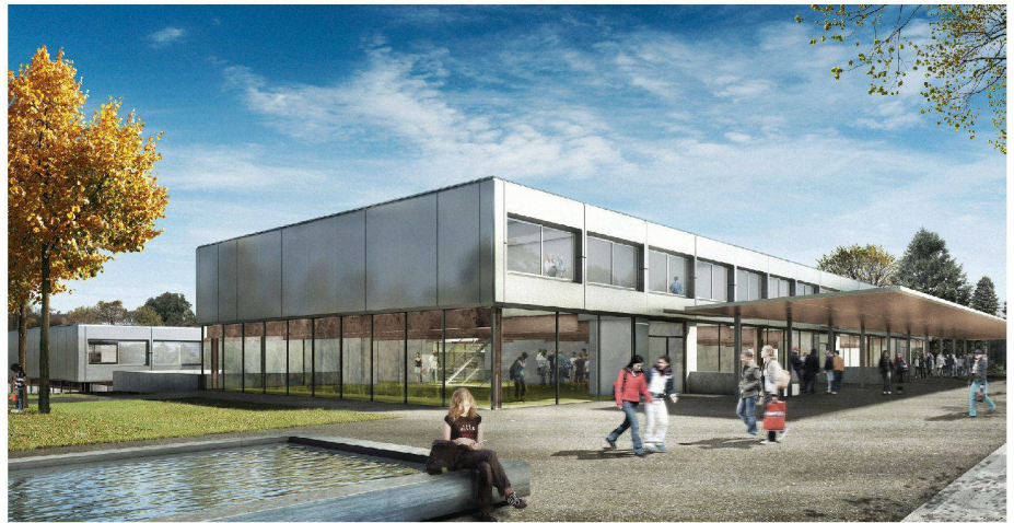
01 Siegerprojekt «Plötzlich diese Übersicht»: Eingangssituation (Egli Rohr Partner, Baden Dättwil)

Die insgesamt sieben eingereichten Arbeiten belegen, dass trotz dem eng gefassten Gestaltungsrahmen und dem bauphysikalisch-technischen Schwerpunkt der Aufgabenstellung von architektonischen Fragestellungen definierte Konzepte auf hohem Niveau entwickelt werden konnten. In Anbetracht der Tatsache, dass Sanierungsmassnahmen zukünftig einen Grossteil der Aufträge für Architekten darstellen werden, darf man hoffen, dass die Qualität der Beiträge Anreiz zur Teilnahme an vergleichbaren Wettbewerbsauslobungen sein und die Teilnehmer-