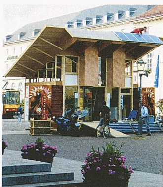
Experiment-Sonnenhaus aus Materialien wie Strohballen, Holz oder Glas