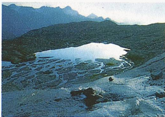
Der Silvrettagletscher soll bald einen Naturlehrpfad erhalten