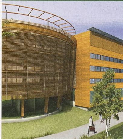
Finnforest Modular Office, Espoo/Finland