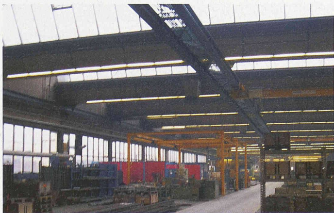
Die Eleganz, die an und für sich gute Bausubstanz und die zweckmässige Architektur sprachen für eine sorgfältige Renovation der 1959 erbauten Weichenhalle der SBB-Schienenwerkstätte in Härkingen