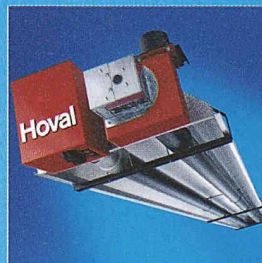
WeiRad. Die Strahlungsheizung für grosse Räume.

Sie integrieren sich unauffällig in Einkaufszentren und Messehallen. Sie beheizen gezielt Teilbereiche in Werkhallen. Sie sparen Energie durch Abbau der Temperaturschichtung. Sie fördern Produktivität mit idealen Arbeitsbedingungen. Die Hoval Hallenklima-Systeme schaffen den Sprung, auch wenn Sie die Messlatte hoch legen. Möchten Sie erfahren, weshalb Betreiber, Planer und Installateure in mehr als 25 Ländern auf Hoval Know-how vertrauen, wenn es um das Lüften, Heizen und Kühlen von Hallen geht? Dann verlangen Sie Unterlagen bei: Hoval Herzog AG, Lufttechnik, Postfach, 8706 Feldmeilen, Tel. 044 925 61 11, Fax 044 923 11 39, info@hoval.ch , www.hoval.ch .