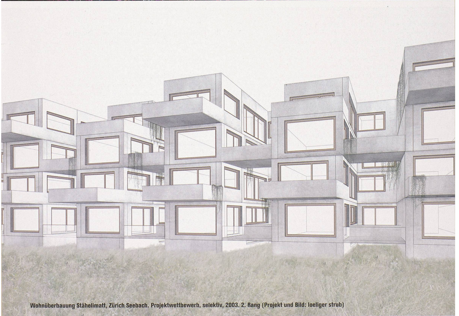
Wohnüberbauung Stähelimmatt, Zürich Seebach. Projektwettbewerb, selektiv, 2003. 2. Rang (Projekt und Bild: loeliger strub)