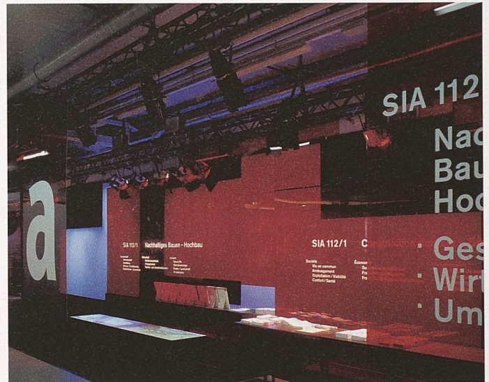
Der Stand des SIA wirkte offen und anziehend. Designer Dominic Niels Haag und Lichtdesigner Michael J. Heusi hatten ihn als Lichtobjekt mit integrierten Bildprojektionen gestaltet

Die Besucher schätzten die offene Gestaltung und zeigten keine Hemmungen, den Stand zu betreten. Das Thema des nachhaltigen Bauens wurde mit regem Interesse aufgenommen. Auch bei den zahlreichen jungen Bauwilligen, die sich nach SIA-Fachleuten, Honorarvorgaben usw. erkundigten, gilt der SIA als verlässlicher und kompetenter Partner.