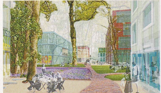
E-Science-Lab nach Plänen der Architekten Baumschlagger-Eberle