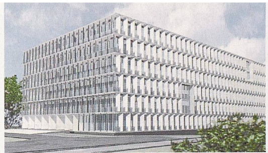
Vision studentischen Wohnens im 21. Jahrhundert