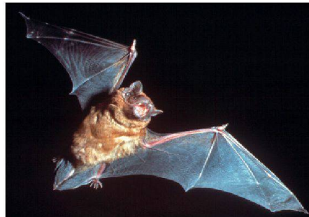
01 Die Grossen Abendsegler leben gerne in Fassadenspalten hoher Gebäude, was zu Konflikten mit den Hausbewohnern führen kann

Fledermäuse fühlen sich in Ritzen und Spalten von besonnten Fassaden wohl. Durch energetische Gebäudesanierungen gehen Hohlräume und damit Unterschlupfmöglichkeiten verloren, auch in Neubauten mit energetisch optimaler Gebäudehülle stehen keine Verstecke mehr zur Verfügung. Diese Entwicklung bedroht die einheimische Fledermausfauna. In industriell vorgefertigten Fledermauskästen können die Tiere aber ein