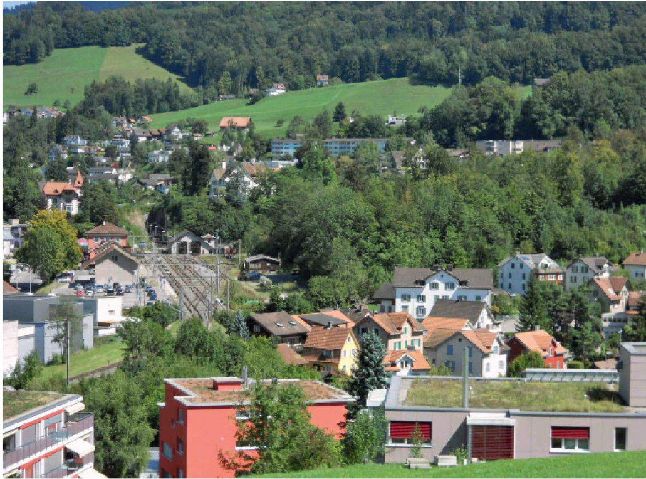
01 Soll künftig ein Teil des für Siedlungen benötigten Landes auf Kosten des Waldes gehen? In der Zürcher Oberländer Gemeinde Wald wird darüber nachgedacht, ein Waldareal neben dem Bahnhof zu überbauen

An einem Fachkongress in Luzern wurde kürzlich über das Verhältnis von Wald und Raumplanung diskutiert. Anlass waren die Debatte über die Flexibilisierung der Waldflächenpolitik, die in der Wintersession im Nationalrat fortgeführt wird, sowie die Revision des Raumplanungsgesetzes.