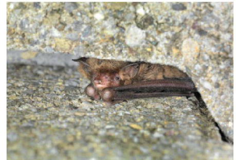
02 Wasserfledermäuse fliegen immer auf denselben Flugstrassen von ihren Verstecken, hier einer Brückenspalte, ins Jagdgebiet. Sie sind vom Mittelland bis ins Gebirge weit verbreitet