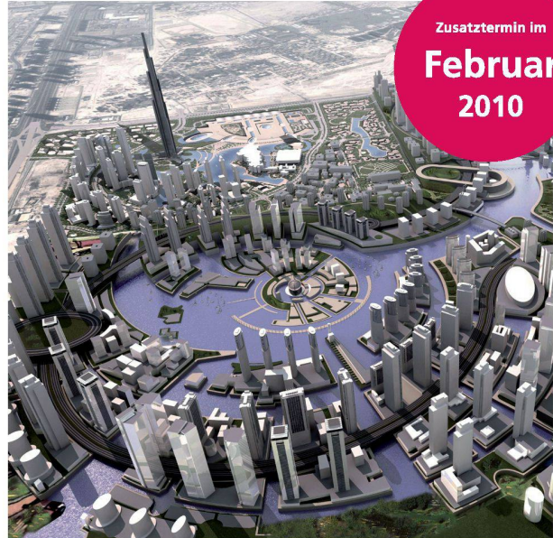
Business Bay, Dubai

Der Gigantismus Dubais zeigt sich auch eindrücklich in den Insel-Projekten «The Palm» und «The World». Die «Palm Jumeirah» wird am Morgen des dritten Tages besucht. Das Herz und die Lunge des modernen Dubai – nicht nur in architektonischer Hinsicht – bildet die Madinat al Arab, die grösste künstlich angelegte Marina der Welt. Dort reihen sich Baukomplexe, wie die Dubai Marina Towers, The Torch Dubai Marina