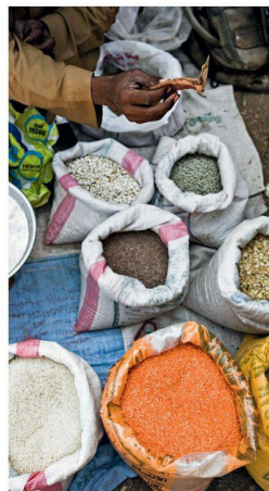
Burj Dubai, exotische Gewürze auf dem Markt in Dubai

Der Gigantismus Dubais zeigt sich auch eindrücklich in den Insel-Projekten «The Palm» und «The World». Die «Palm Jumeirah» wird am Morgen des dritten Tages besucht. Das Herz und die Lunge des modernen Dubai – nicht nur in architektonischer Hinsicht – bildet die Madinat al Arab, die grösste künstlich angelegte Marina der Welt. Dort reihen sich Baukomplexe, wie die Dubai Marina Towers, The Torch Dubai Marina