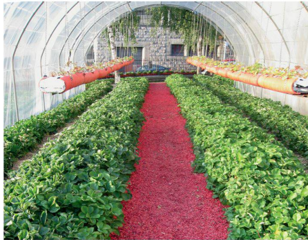
01 «La Revanche de la Fresa»