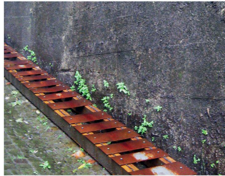
02 «Secrets de gouttes»