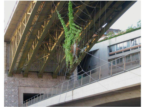
03 «Green Trap»

Zum vierten Mal findet dieses Jahr das Festival «Lausanne Jardins» statt. Unter dem Motto «Jardins dessus dessous» sind 34 landschaftsarchitektonische Interventionen entlang von fünf Routen zu sehen.