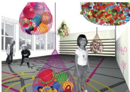
01 Siegerprojekt «Spielbox» (Visualisierung: Heike Heldt)