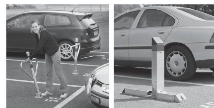
Robust, zuverlässig: «Autopa» für manuelles und «CityParker®» für automatisches Sichern des Parkfeldes.

Ihr servicestarker Partner mit innovativen Lösungen: