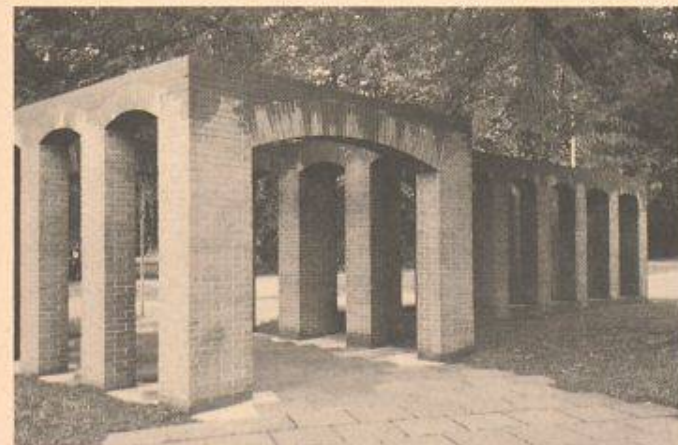
Skulptur aus Kemano-Sichtsteinen von Per Kirkeby im süddeutschen Göppingen

deutschen Göppingen eingeweiht werden konnte, stellt einen Schwerpunkt im Rahmen des Skulpturprojekts 1992/93 der Kulturregion Stuttgart dar. Steine aus Ton, des Künstlers bevorzugtes Material, fanden 1973