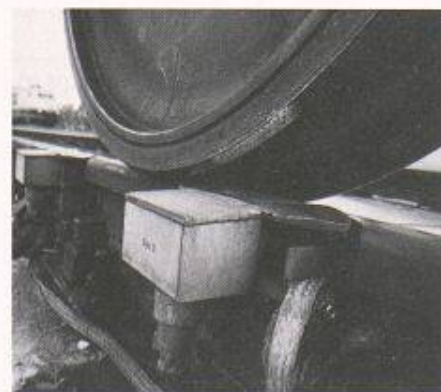
Die Auropa-Prüfanlage sitzt da, wo der Materialverschleiss am grössten ist: am Kontaktpunkt Rad/Schiene

Inzwischen haben auch die skandinavischen, britischen, spanischen und französischen Eisenbahnen Interesse an Auropa angemeldet. Der wachsende Bedarf an Ultraschallprüfungen im Schienenverkehr hängt vor allem mit der Entwicklung der Hochgeschwindigkeitszüge zusammen. Amerikanische und kanadische Eisenbahngesellschaften wollen Auropa-Checkpoints jedoch auch für schwere Güterzüge installieren.