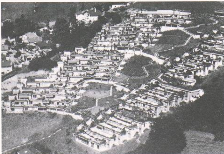
Im letzten Jahrzehnt zog es die Bevölkerung immer mehr «auf's Land». Die Einwohnerzahl in den Grossstädten ging dagegen zurück

Das Gewicht der fünf Grossagglomerationen Zürich, Genf, Basel, Bern und Lausanne ging in der betrachteten Periode infolge eines unterdurchschnittlichen Bevölkerungswachstums zurück. Die fünf Grossstädte verloren insgesamt 44 400 Einwohner (-4,5%) und zählten Ende 1990 deren 937 300. In den die Grossstädte umgebenden Agglomerationsgemeinden wuchs die Bevölkerung jedoch überdurchschnittlich um 7,7% auf 1,22 Mio. Einwohner.