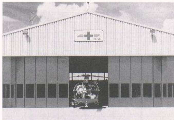
Falltorfront, Rega-Stützpunkt Gossau: Rasches Öffnen, gute Wärmedämmung, lange Lebensdauer