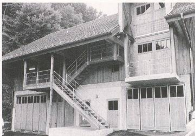
Handfalttore, Werkhof Fällanden: Bautypangepasst mit Holzfüllungen, leichtgängig, gute Wärmedämmung, lange Lebensdauer