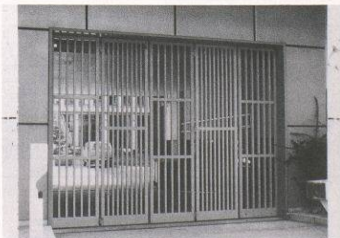
Gitter-Falltorfront als Abschluss für Sicherheitsschleuse für Geldumschlag: Robuste Bauweise, rasches Öffnen, lange Lebensdauer