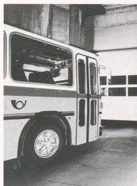
Sektionaltor in Post-Garage: Kleiner Platzbedarf, gute Wärmedämmung

Was vielfach vergessen wird und beim ersten Torschaden zum Vorschein kommt (z.B. durch Rammen eines Fahrzeuges), ist die unterschiedliche Reparaturfreundlichkeit der verschiedenen Torarten. Da solche Schäden selten durch Versicherungen gedeckt sind, lohnt sich das sorgfältige Studium dieses Problemes. Ein Gespräch mit einem Spezialisten der Torbautechnik in einem frühen Planungsstadium – möglichst schon in der Vorprojektphase – spart meistens Baukosten, spätere höhere Betriebskosten sowie unnötigen Ärger. Auf diese ganz spezifischen Pro-