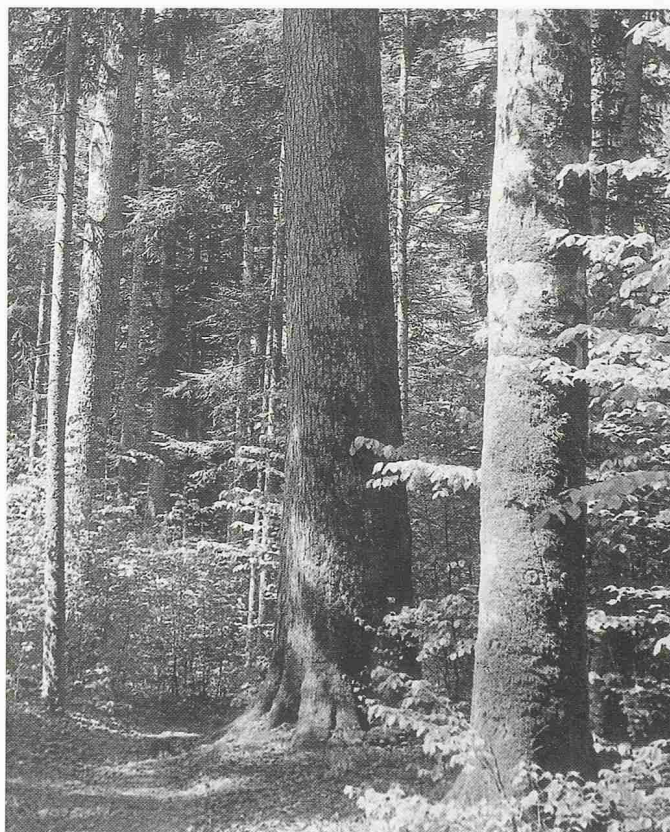
Bild 4. Der natürliche Wald bildet ein äusserst komplexes Ökosystem von Pflanzen, Tieren und Mikroorganismen, das sich dauernd auch ohne Zutun des Menschen in einem biologischen Gleichgewicht erhält. Bild: Urwald im Bayerischen Wald

len kann. Dazu kann ein rein nach Überlegungen der wirtschaftlichen Rationalität und der Nachhaltigkeit der Bestockung behandelter und entsprechend aufgebauter Wald in der Regel nicht genügen. Nicht selten münden diese erwähnten Forderungen daher in das Verlangen nach entsprechender Intervention bzw. nach einem Mitspracherecht bei der Planung und Durchführung der Waldbewirtschaftung aus.