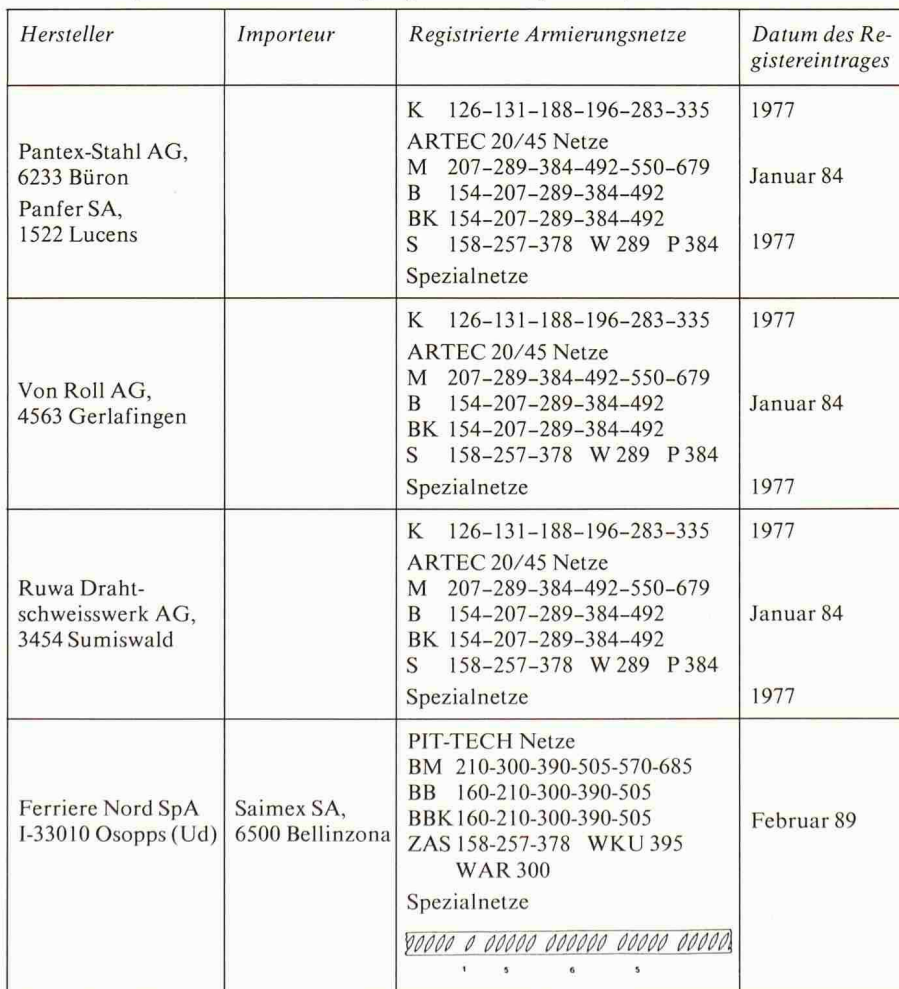
Register der normkonformen Armierungsnetze (Stahl S 550) nach SIA-Norm 162 Stand des Registers am 1. Mai 1989 (gültig bis Ende August 1989)

gie mécanique periodisch Stichproben untersucht. Die Produkte werden nur solange im Register geführt, als die Resultate der Qualitätskontrollen den Anforderungen der Norm SIA 162 genügen. Das Register der Armierungsnetze wird dazu alle vier Monate auf den aktuellen Stand gebracht und hat deshalb keine unbeschränkte Gültigkeitsdauer.