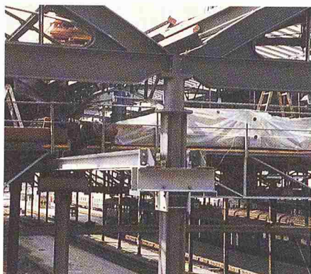
Bild 4. Nördliche Hallenverlängerung mit Schutz- und Arbeitsbühne