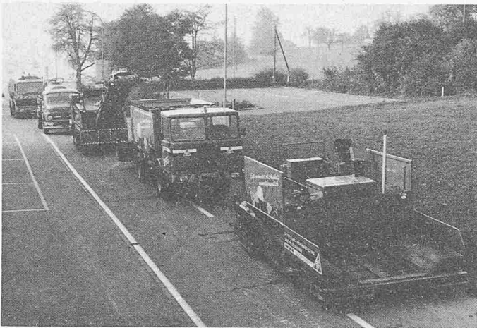
Strassensanierungs-Maschinen: Kaltrecycler, Kaltmikromaschine, Hochleistungs-Kaltfräse, Hochdruck-Waschmaschine, Saug-Wisch-Maschine.