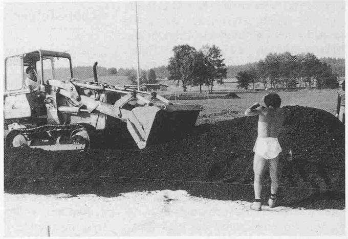
Bild 3. Verteilen und Planieren der zementstabilisierten Kehrichtschlacke auf der Baustelle. Die Verarbeitung kann auch mit einem Fertiger erfolgen

reichlich Sand. Der hohe Feinanteil (vor allem im Bereich von 0,06 - 0,2 mm Korndurchmesser) macht sie wasserempfindlich. Eine Zementbeigabe von 70-80 kg/m 3 reduziert die Wasseraufnahmefähigkeit, erhöht die Frostbeständigkeit und bewirkt eine zunehmende Druckfestigkeit (4 N/mm 2 nach 28 Tagen). Kehrichtschlacke hat eine Trockenrohdichte von nur 1,7 t/m 3 , was auch die Frosteindringtiefe verringert. Feldversuche mit Deflektionsmessungen haben ergeben, dass sich stabilisierte Kehrichtschlacke gleich verwenden lässt wie stabilisierter Kiessand.