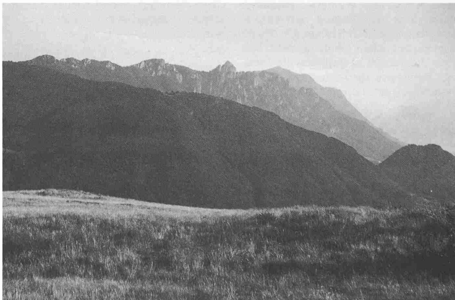
Rundsicht von Pastura (über Signora) über den grossen Schlagwald (mehr als 300 ha) im Gebiet Vallone-Alpaccio-Mator dei Falchetti (Sonvico)