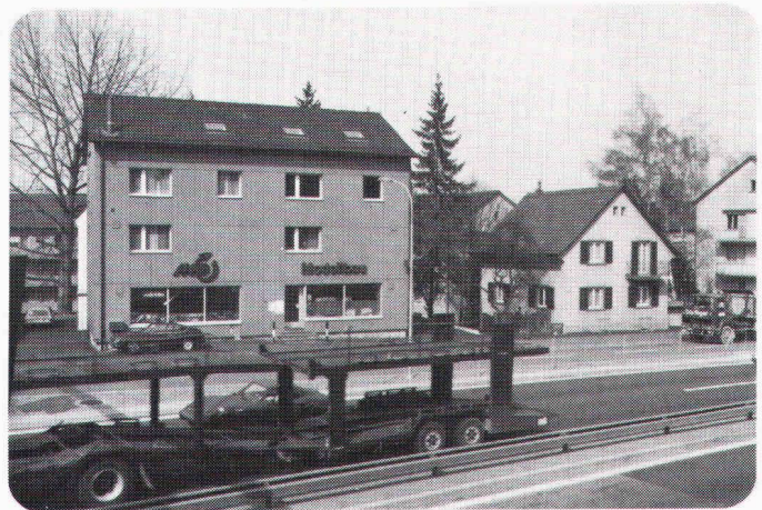
CARDOPHON®-EXTRAPHON Wohn- und Geschäftshaus an der Überlandstrasse, Zürich