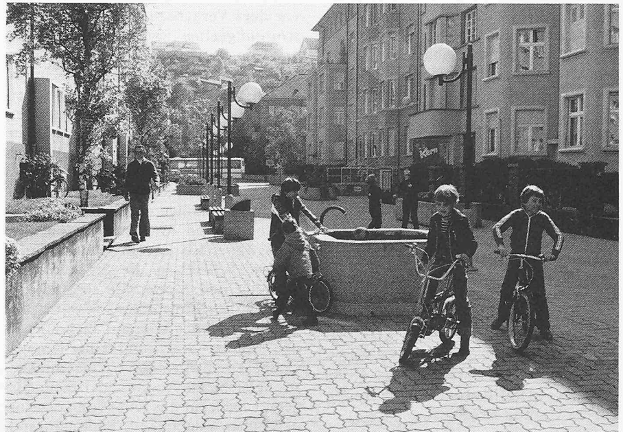
Ein Ansatz: Die Laufenstrasse in Basel

«Weil es an Schlaf fehlt, gehen in Rom viele Kranke zugrunde», schrieb schon Juvenal. Wir haben es nicht viel weiter gebracht. Von alten ägyptischen Darstellungen wissen wir, dass die Stadtbewohner den Eindringlingen und Eroberern ihre Kinder als Versöhnungsgaben anboten. Wenn wir unsere Unfallstatistiken betrachten, stellen wir mit Entsetzen fest, dass auch wir offenbar bereit sind, den modernen Stadteroberern und Stadterstörern unsere Kinder als Opfer zu überlassen.