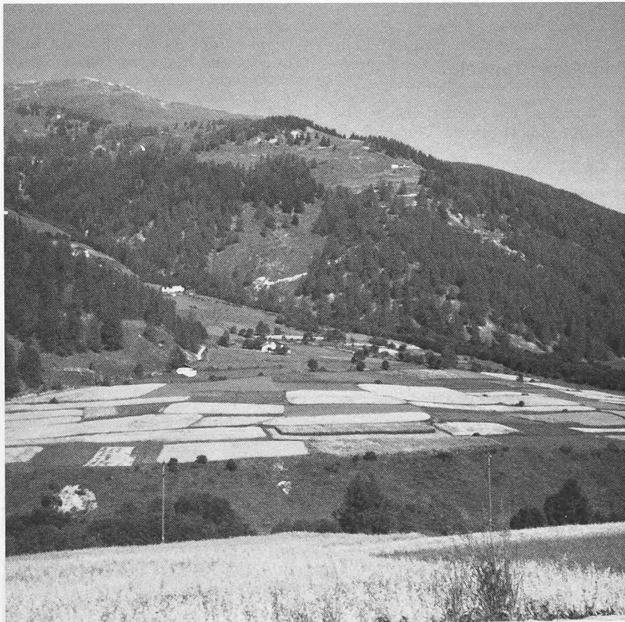
Wiesen, Äcker und Weiden bei Santa Maria im Müstertal

für die Sachgebiete Landwirtschaft, Meliorationswesen sowie Landschaftsschutz und Raumplanung zu berücksichtigen. Dabei ist festzustellen, dass in den verschiedenen Kantonen der Schweiz die Materie recht verschiedenartig geordnet ist. So sind etwa die Bestimmungen der Kantone Waadt und Graubünden wie auch die zugehörige Praxis nicht ohne weiteres vergleichbar. Hingegen lassen sich im Sinne des erwähnten Bundesrechts gemeinsame Grundsätze und Möglichkeiten darlegen.