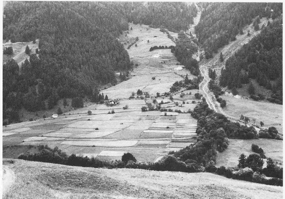
Überwachsener Bachschuttkegel bei Santa Maria

Auf der Ebene des Bundes ist vor allem die Koordination zwischen Kantonen und die Beachtung der Interessen des