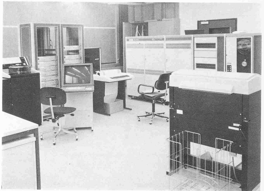
Fig. 1. Un ordinateur récent coûtant environ SFr(79) 500 000.- (VAX11-780)