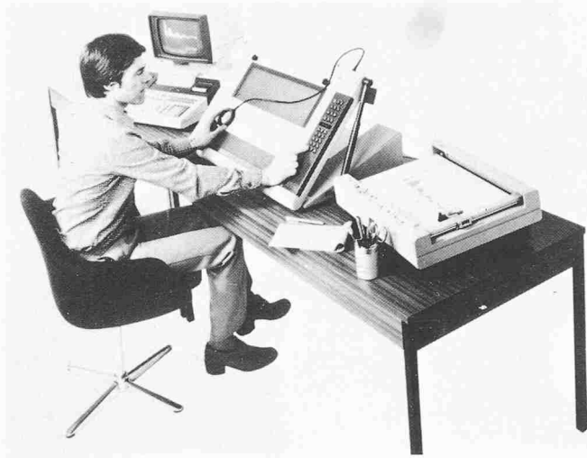
Fig. 3. Ordinateur de table avec traceur de courbes et tablette de digitalisation (HP 9845)