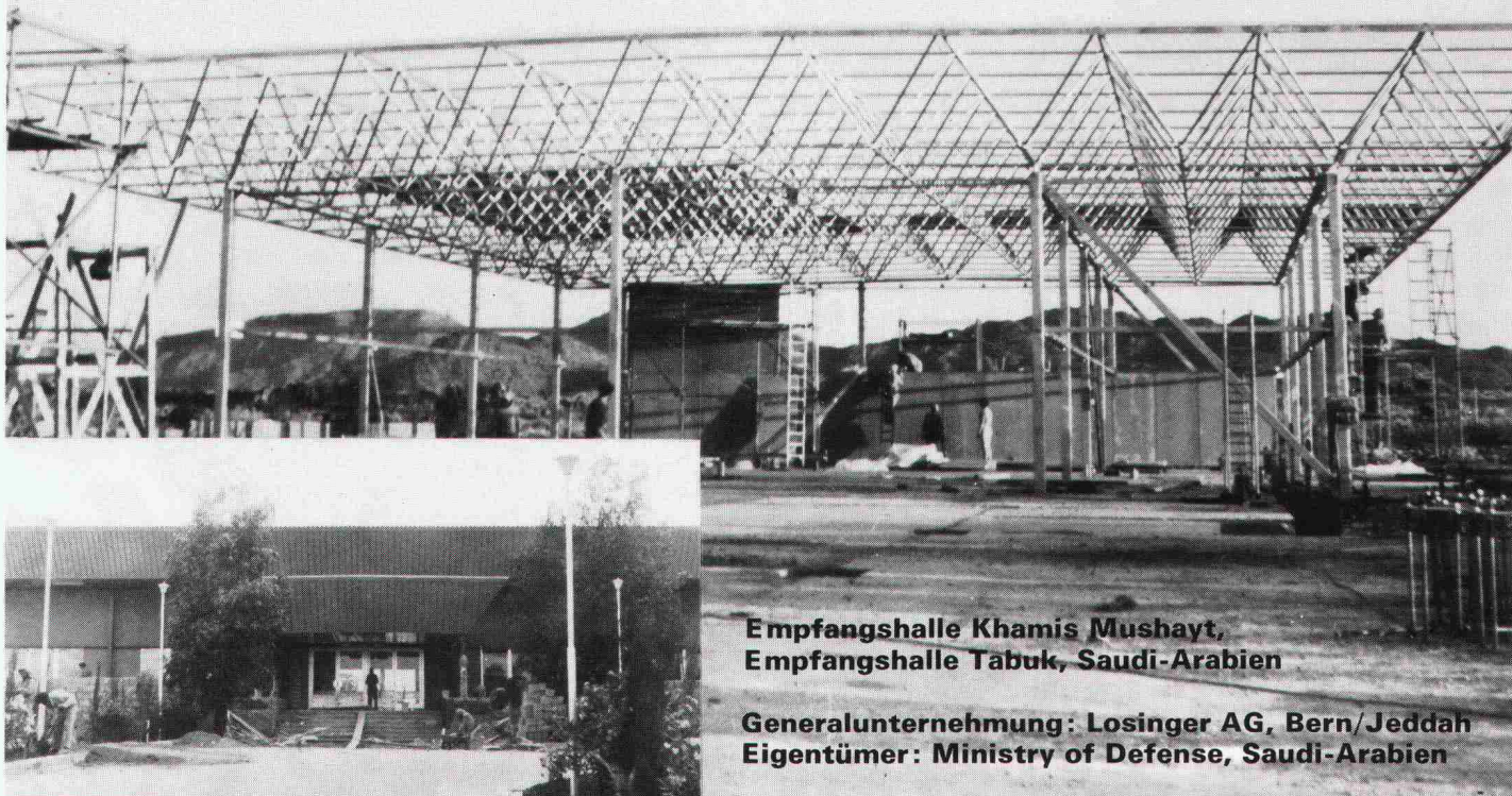
Empfangshalle Khamis Mushayt, Empfangshalle Tabuk, Saudi-Arabien

Monbijoustrasse 16 Telex 33260 mapa ch, Tel. 031 25 43 55/56