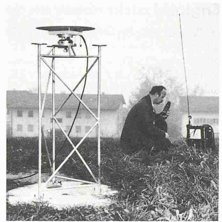
Mit Hilfe einer neuen, satellitenunterstützten Vermessungsmethode wurde die Position von 24 Kontrollpunkten in der Nordschweiz millimetergenau bestimmt. Die Antenne steht genau über einem einbetonierten Vermessungspunkt. Die empfangenen Signale, die von Satelliten ausgesandt werden, werden über ein Antennenkabel an ein transportables Empfangsgerät weitergeleitet

Aus der präzisen Vermessung von Bezugspunkten in den Kantonen Baselstadt, Solothurn, Aargau, Zürich und Schaffhausen kann sowohl die Landestopographie als auch die Nagra grossen