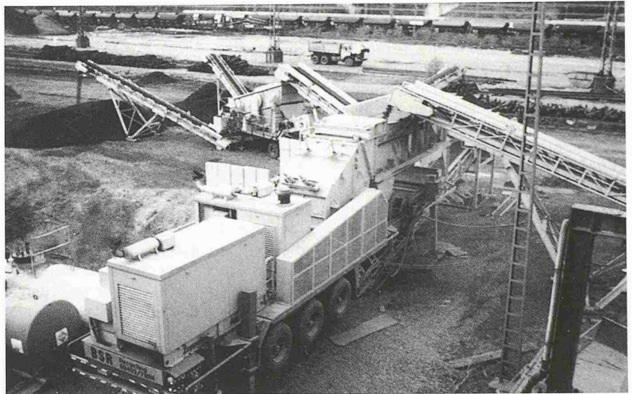
Eine mobile Bauschutt-Recyclinganlage wird in Köln eingesetzt, um den ehemaligen Eilgutbahnhof Gereon altlastenfrei abzubauen. Käufer des 200 000 m 2 grossen Areals ist die Stadt Köln

Für den Abriss der Gebäude kommen Bagger zum Einsatz und für die Demontage der Umladehallen Kräne. Schneidevorrichtungen an den Hydraulikbaggern sorgen für das Zerkleinern der Stahlträger. Für die Belieferung der Recyclinganlage selbst sorgen Raupen