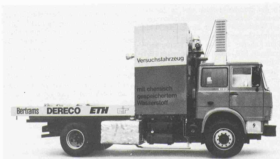
Bild 1. Wasserstoff-Versuchsfahrzeug der 2. Generation