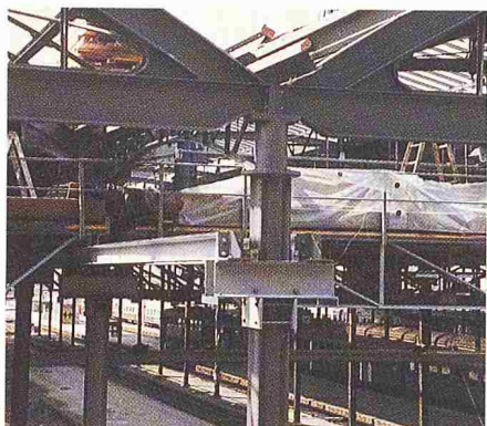
Bild 4. Nördliche Hallenverlängerung mit Schutz- und Arbeitsbühne