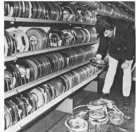
Was sind Brandmelder wirklich wert? Hunderttausende von Fr. wären hier ein Raub der Flammen geworden. Dank Frühalarm konnte der Brand in Schach gehalten werden

Gewissermassen als Gegenstück zu diesen englischen Untersuchungen hat die in der automatischen Brandmeldung weltweit als Pionier bekannte Schweizer Firma Cerberus