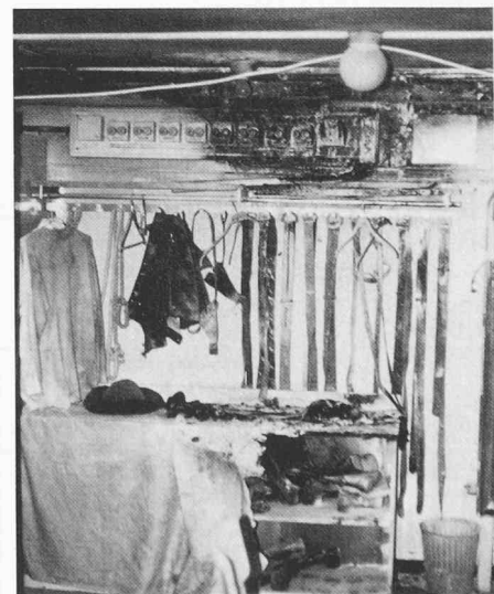
Ein praktisches Beispiel der Brandentdeckung in einem Theater: In der Garderobe entzündeten sich Kostüme, und die Flammen griffen bereits gegen den Sicherungskasten. Dank automatischer Entdeckung konnte das Feuer sofort gelöscht werden