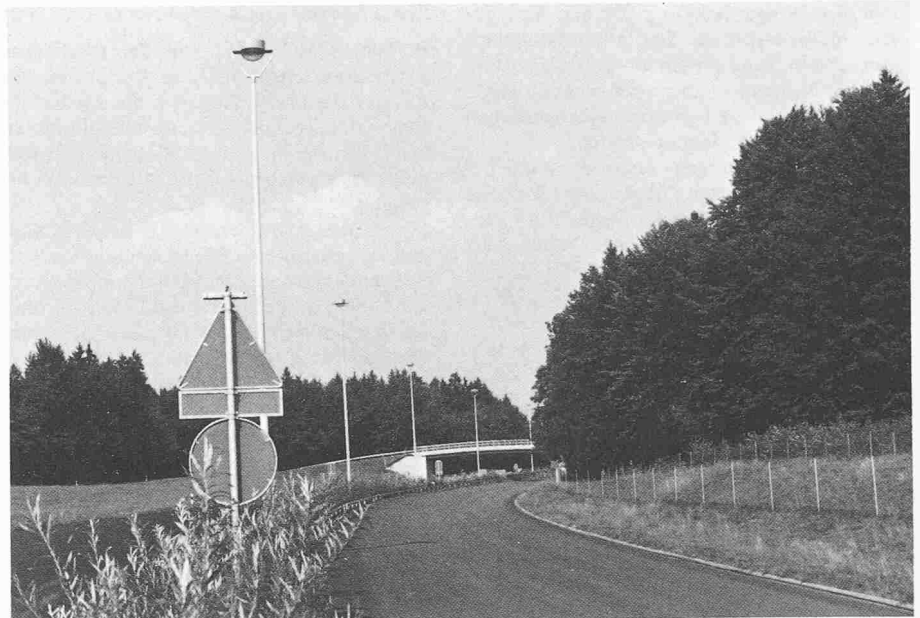
Bild 3. Beleuchtung entlang der Autobahn, Lichtpunkthöhe 15 m, Lichtpunktabstand 60 m

Die Kosten für die Beleuchtungssteuerung und die Erfassung der dazu nöti-