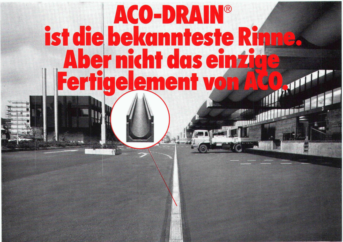
SBB Schnellgutstammbahnhof Zürich

ACO-DRAIN® ist die bekannteste Rinne. Aber nicht das einzige Fertigelement von ACO.