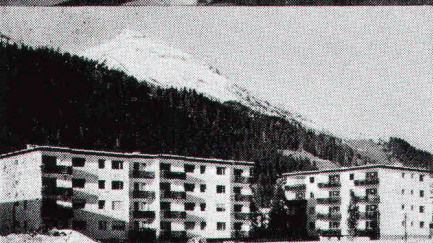
Überbauung Rietstrasse, Elektrizitätswerk der Landschaft Davos; total 33 Wohnungen; Anschlusswert ca. 400 kW

Star Unity AG Fabrik elektrischer Apparate Zürich, in Au/ZH Tel. 01 75 04 04